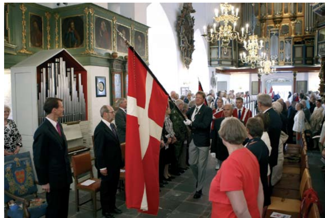
Aalborg kredsens fane føres som den første af de mange ind til flaggudstjenesten.

Efter den korte reception fandt faneoverrækkelsen sted på Gammel Torv, der nu var smukt omkranset af utallige foreningsfaner, der fra to startsteder i byen var marcheret til byens centrum og nu mødtes til fest.