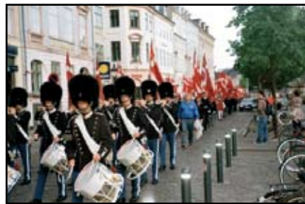
Med Livgarden i spidsen marcherer fane-paraden fra Holmens Kirke til Rosenborg Eksercerplads.