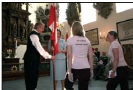
Hendes Højhed Prinsesse Elisabeth uddeler fane til Øbro Gymnastikforening.