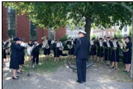
Kvindeligt Mariners Musikkorps underholder før jubilæumsfestlighederne i Holmens Kirke.