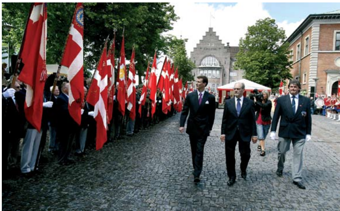
HKH Prins Joachim hilser på nogle af de mange fremmødte foreningsfaner.