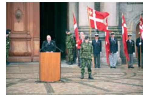
Forsvarsminister Søren Gade taler til alle soldater, ude som hjemme, på Christiansborg Slotsplads.