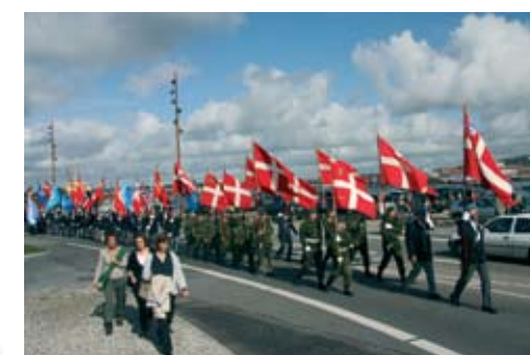
Faneoptog i Aalborg på vej fra Budolfi Kirke til Aalborghus Slot, hvor dagens højtidlighed blev rundet af med tale af blandt andet Christian Mejdal, Folketingets tidligere formand.