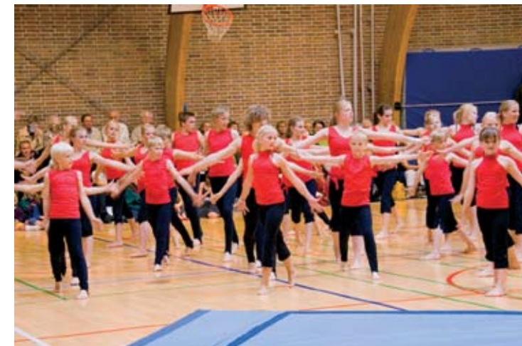
De dygtige Trustrup Springere underholder det store publikum med deres færdigheder ved flagfesten.

Der var lagt op til en stor Valdemarsfest i Thorsager Kirke og i byen. Festlighederne begyndte som altid med at alle faner og publikum mødtes i kirken til en kort gudstjeneste. Der var så fyldt at ikke alle kunne være i kirken. Efter gudstjenesten