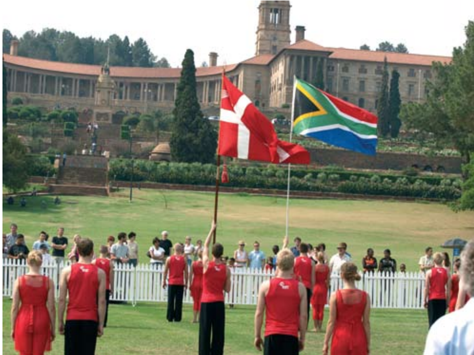
DGI Verdensholdet ved den Sydafrikanske Regeringsbygning i Pretoria

fædrelandet på afstand, og det kalder ofte på stærke følelser når vi synger "Der er et yndigt land" og bærer fanen ind.