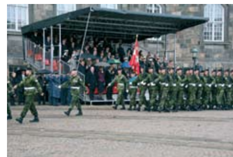
Den kgl. Livgarde paraderer for æresgæster og de mange udenlandske militære repræsentanter.