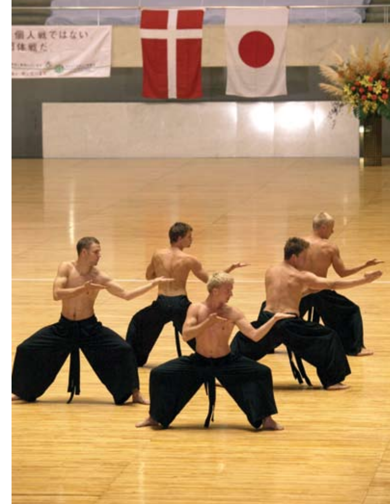
I det fjerne Japan i hovedstaden Tokio

Dét bliver ikke vores sidste møde med militæret. En