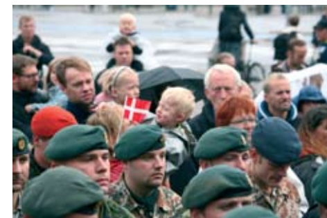
Christiansborg Slotsplads var præget af flag og faner. Her er et af de helt små flag og en af de helt små deltagere, der måske svinger med flaget for farmand.