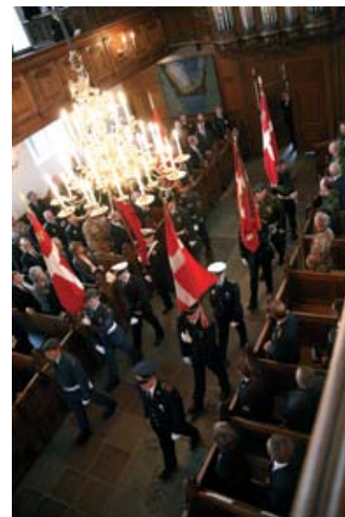
Ved mindegudstjenesten i Holmens Kirke for de udsendte, der satte livet til, deltog pårørende og det officielle Danmark. Her føres korpsfanerne ind i kirken