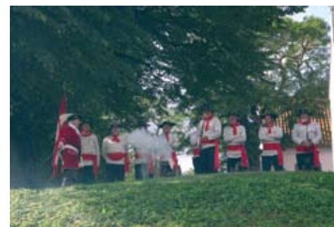
Aalborg Kanonlaug saluterer for flagdagen og for faneoptoget på Aalborghus Slot