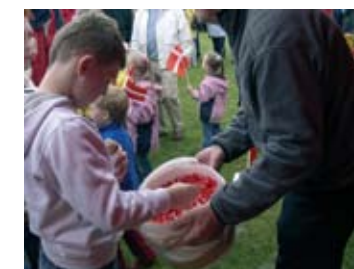
Dannebrogbolcher er en sikker træffer, der kommer børn til og såmænd også mange voksne

Rasmussen, Haderslev, og de tog tønnen i udstillingsteltet. Også de havde en inspirerende dag med forskellig underholdning og fin kontakt til mange mennesker.