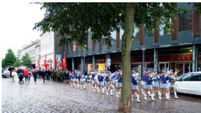
Randers Pigegarde førte an igennem byen