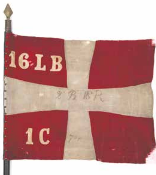
Kompagnifane fra 20. Infanteri-Bataillon, 8. Compagni. Skænket til Sønderborg Slot af Felicitas og Werner Kraus i 1993 sammen med den anden kompagnifane.

Derimod blev der på slagmarken både 18. april og 29. juni efterladt mange kompagnifaner, og fra erobrenes side blev der