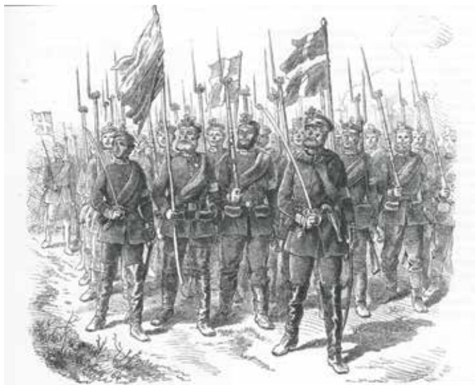
Königsparede ved Adsbøl nær Gråsten den 21. april 1864. De preussiske tropper defilerer forbi kong Wilhelm af Preussen med danske faner. Stik efter tegning af Wilhelm Camphausen, der overværede paraden. Der blev rejst en sten til minde om denne parade, og den kan endnu ses i Adsbøl.

Et par måneder senere kom ægteparret Kraus imidlertid med de to faner som en gave til Sønderborg Slot. Da