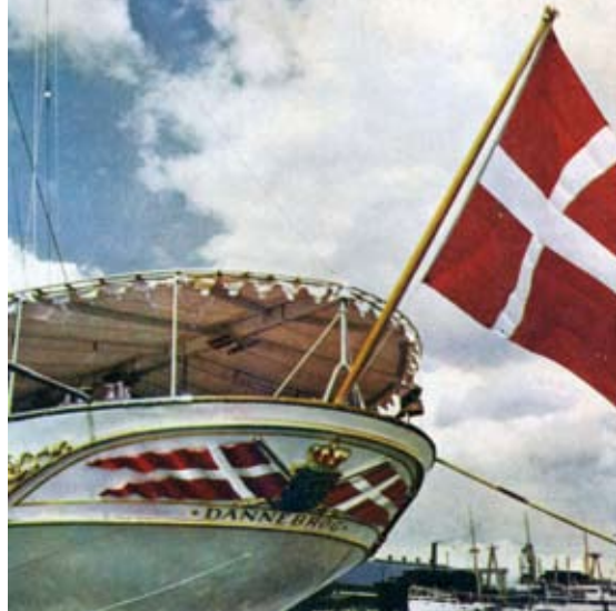
Hækken på Kongeskibet Dannebrog

Et karakteristisk træk ved den her beskrevne udvikling er den stadige kamp fra civile og private for at få lov til at bruge splitflaget. En popularitet, som det har været svært for myndighederne at dæmme op for. Hvad årsagen til denne