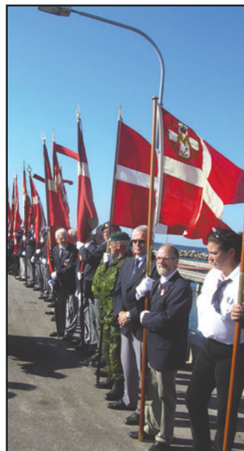
Billedet er fra Klintholm Havn, hvor man venter på Regentparret.

Den 6. september gennemførte Regentparret et ø-besøg på Møn, og her skulle der også opstilles en faneborg på kajen i Klintholm Havn. Planen var, at Kongeskibet skulle ankomme til Klintholm Havn, men på grund af for megen blæst kunne chaluppen ikke klare de høje bølger, hvorfor skibet måtte sejle til Bogø, hvorfra regentparret blev transporteret i kronebil til Klintholm Havn, hvor den planlagte velkomst kunne gennemføres. Faneborgen i Klintholm Havn var uden de militære enheder.