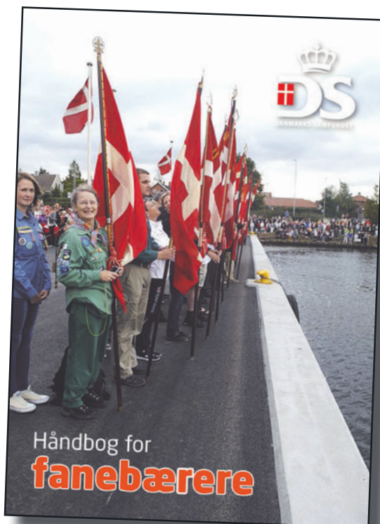
Danmarks-Samfundets nye bog: Håndbog for fanebærere

Men en fane er også et historisk virkemiddel. Dannebrogsfanen knytter os til generationerne før os. Det var dengang, hvor danskerne samledes om de samme idéer og under det samme symbol som nu. Ved at vise respekt for Dannebrog, viser vi samtidig respekt for vores idealer.