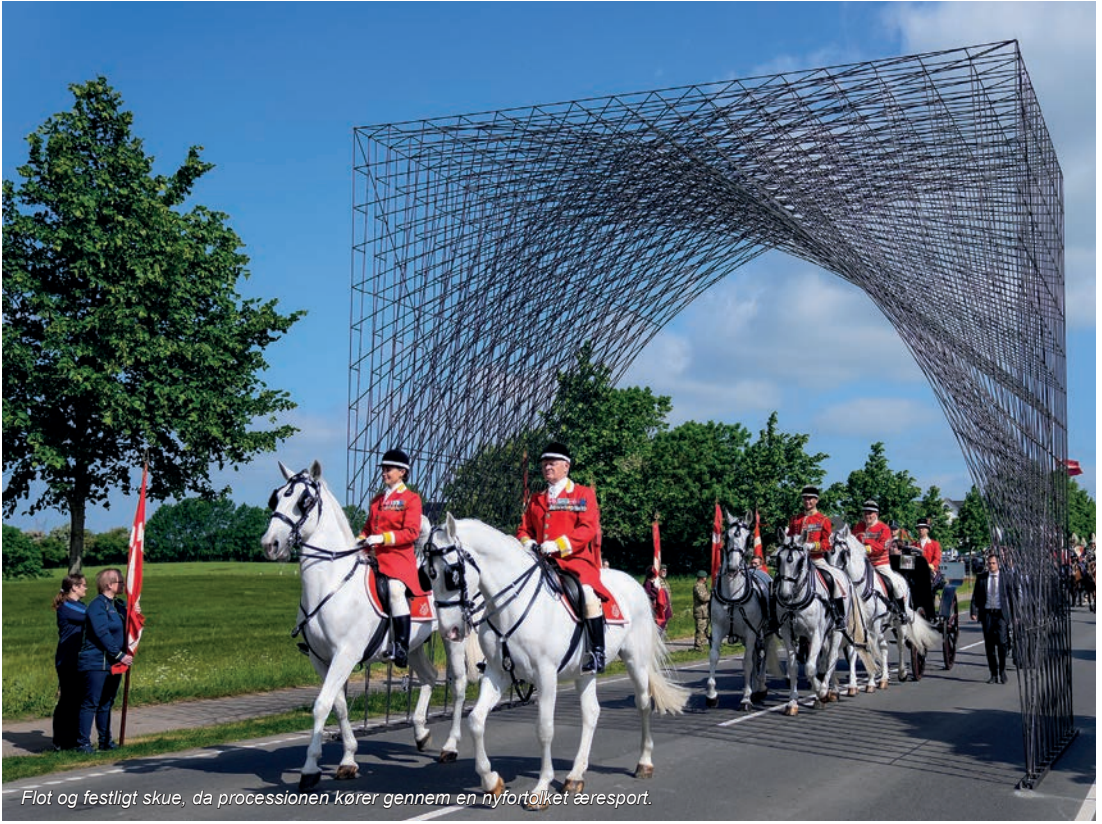
Flot og festligt skue, da processionen kører gennem en nyfortolket æresport.