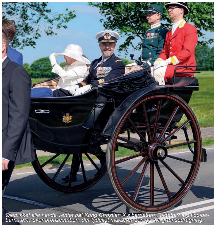
Øjeblikket alle havde ventet på! Kong Christian X's barnebarn, oldebarn og tipoldebarn kører over bronzestriben, der tydeligt markerer den gamle grænsestrækning.