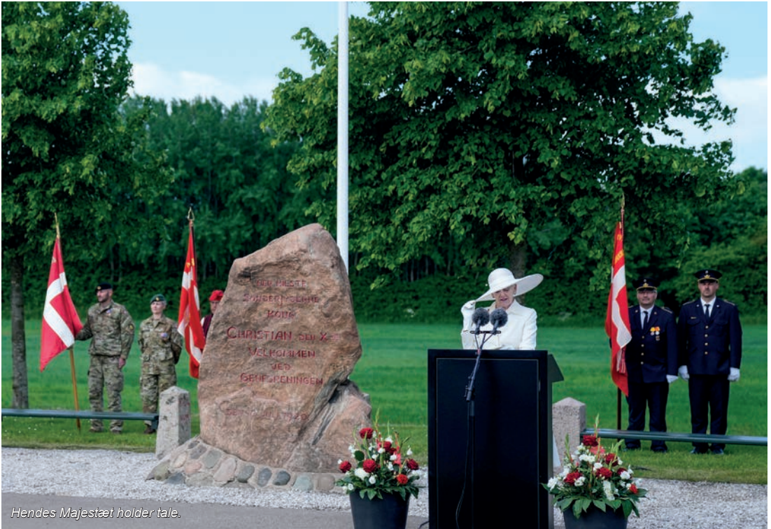
Hendes Majestæt holder tale.