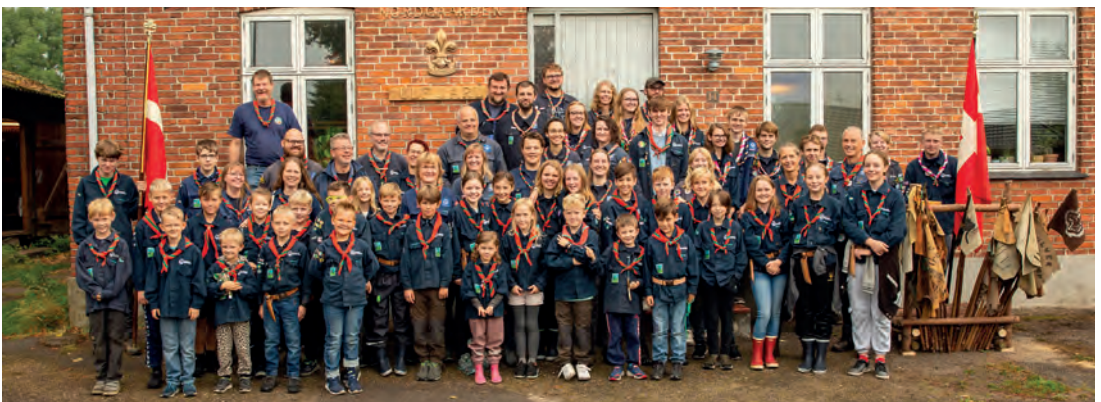
Den 11. september 2021 markerede Ulf Jarl Gruppen fra Det Danske Spejderkorps deres 75 års fødselsdag. I den forbindelse modtog de unge spejdere som vist på vedstående foto to nye faner fra Danmarks-Samfundet.