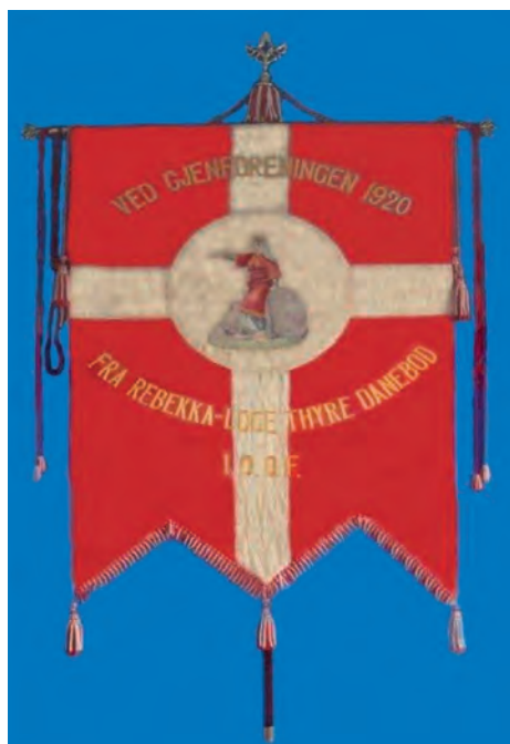
Det unikke genforeningsbanner fra 1920 er tilbage hos Odd Fellow Ordenen.

I 1998 gøres der et mislykket forsøg på at få banneret hjem til Ordenen, idet ordenens Museumsudvalg bliver interesseret i muligheden for at udstille dette klenodie på Ordensmuseet.