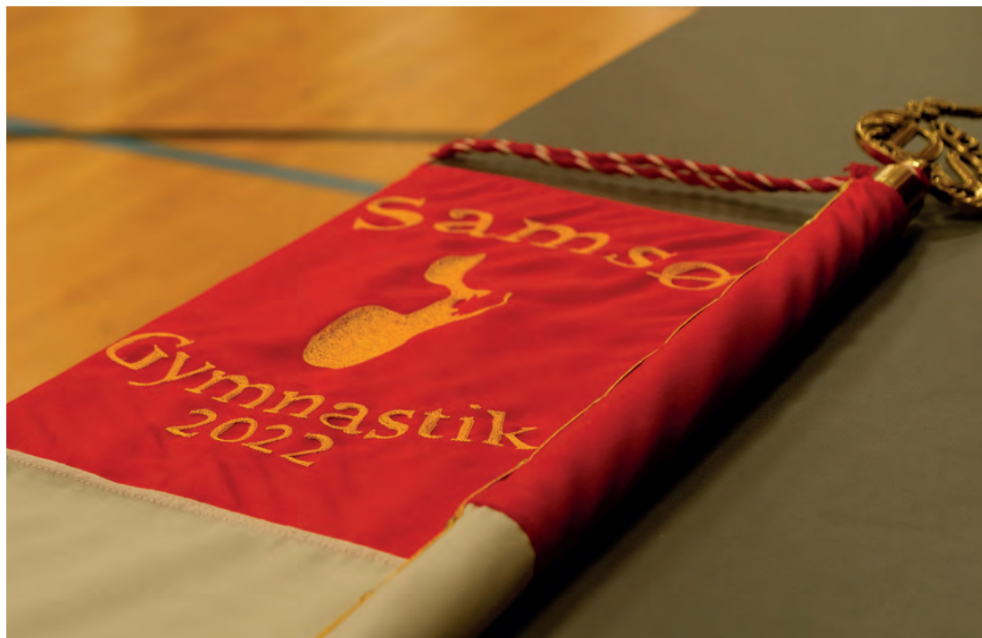
Samsø Gymnastiks fane med det smukke broderi af øen og årstal.